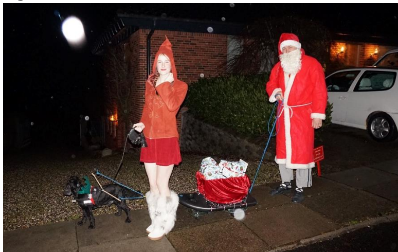
(foto: 2 socialkammerater med rensdyret Basil på vej med julegaver til naboens børn)

På et tidspunkt lavede jeg en låge midt i haven, så Basil selv kunne bestemme, hvornår han havde lyst til at kigge ind til os, og blive forkælet med en lille kiks - hans glade vuf og logrende hale vil blive savnet.