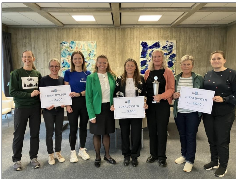
Fra uddeling af årets præmier i Lokaldysten.

Næste A-dialog forventes udsendt ultimo november måned, og har du ideer til indholdet er du velkommen til at kontakte/sendt det til redaktionen: