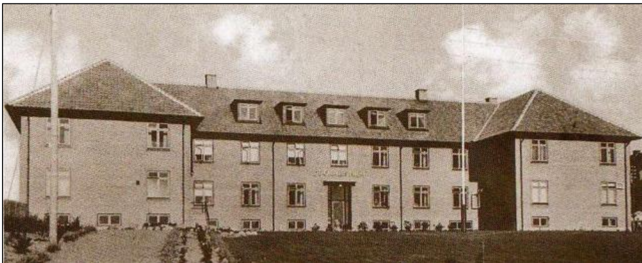
"De gamles Hjem", senere Kejlstruplund – bygget i 1938

Aftalen var klar i budgettet for 2023. Undersøgelserne skulle sættes i gang. I lokalrådet havde vi allerede talt med forvaltningen om hvor de mulige placeringer kunne være, og havde sagt ja til en placering på boldbanerne ved Nordre Skole, da det blev gjort os klart, at det hastede. Pladserne manglede akut, så selvom det ville koste endnu et af Alderslyst få grønne områder livet, så nikkede et enigt lokalråd til placeringen. Vi blev lovet deltagelse i områdestudier og en helhedsplan for hele området var på tegnebrættet.